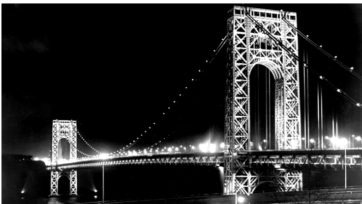
En juin 1964, le Pont Georges Washington à New York est illuminé avec 84 projecteurs de lumière incandescente Perrot Duval.