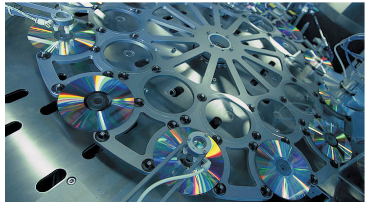
Une exécution de 2005: une installation de production de DVD de la société Unaxis entièrement automatisée par Perrot Duval.

PERROT DUVAL est une PME internationale qui vit au rythme de l'innovation