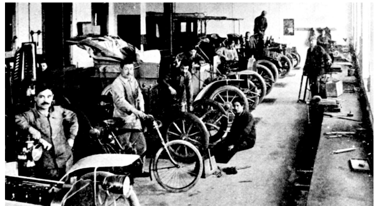
Les ateliers Perrot Duval de fabrication de voitures automobiles et de cycles en 1910.