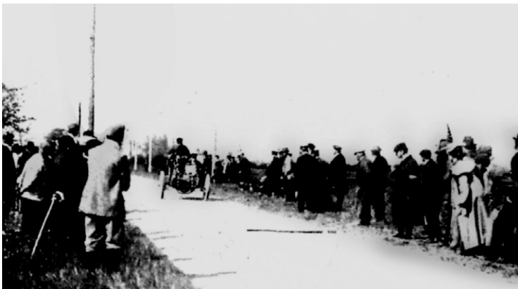
En 1903, Gaston Perrot remporte la Course du kilomètre lancé d'Eaux-Mortes à la vitesse «vertigineuse» de 90 km/h.