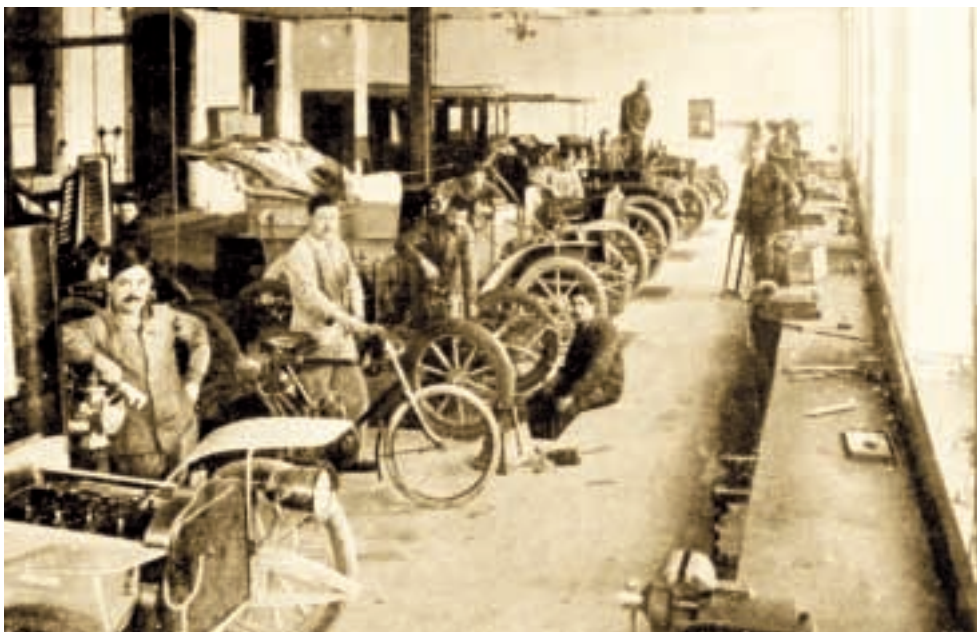
Les ateliers Perrot Duval permettant la construction d'automobiles et de cycles.

Perrot Duval monte aussi des moteurs pour une série de croiseurs du Chantier Naval de Corsier. L'entreprise fabrique également des embrayages pour canot moteur. Un de ces croiseurs s'adjugera de haute lutte, en 1913, le Championnat de la mer à Monte Carlo en couvrant 200 km à la moyenne de 61.650 km/h.