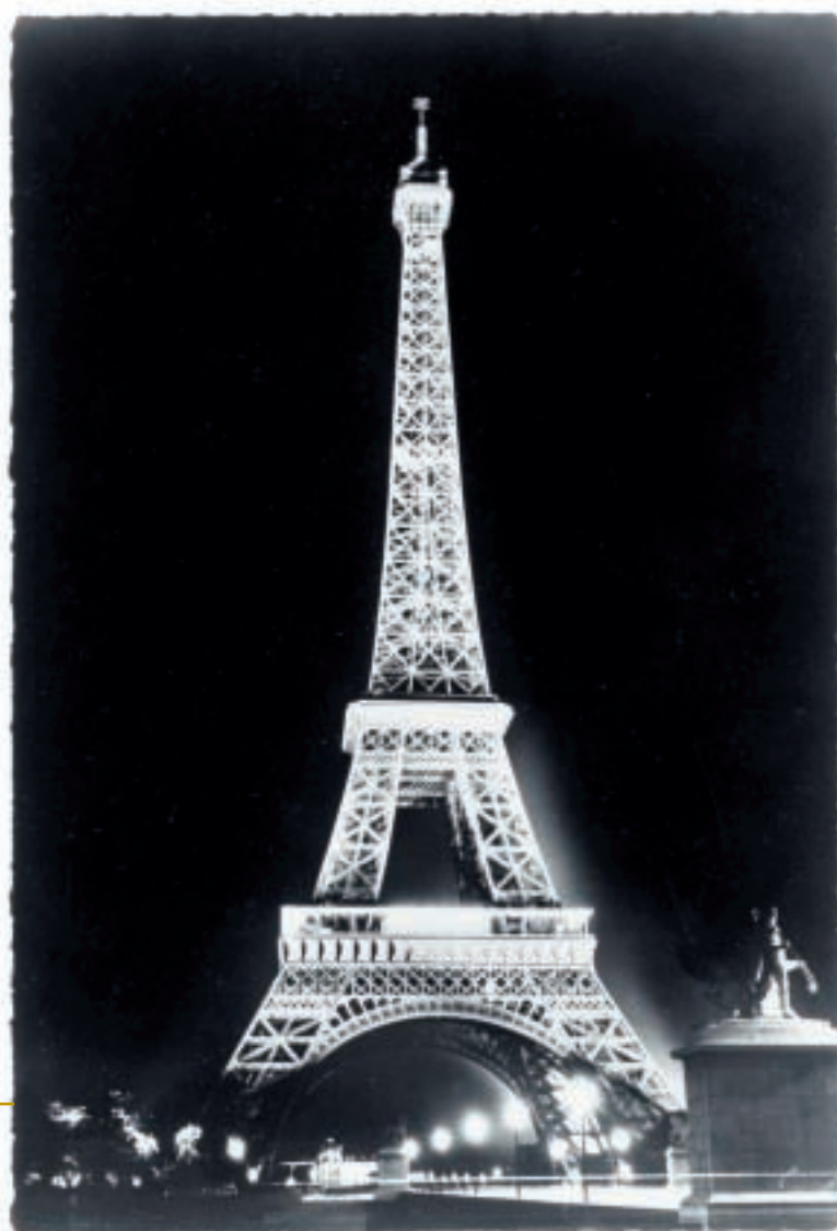
La Tour Eiffel à Paris, en mai 1958 illuminée par 170 projecteurs de 3kW.