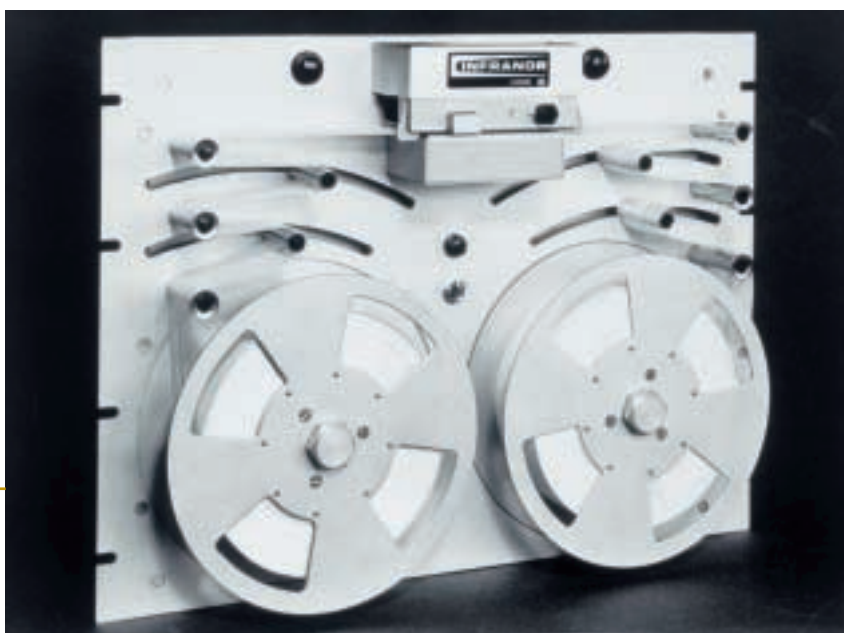
Lecteur photoélectrique à ruban type SP, avec versions spéciales pour ruban de 13 et 16 canaux, pour ruban Olivetti et tête de lecture pour code Ecma et TTS.

Perrot Duval reprend, à travers Infranor S.A., Electravia, un laboratoire créé à Genève par Bill Lear, l'inventeur du pilote automatique. Dans les dossiers de cette acquisition, Perrot Duval trouve la représentation exclusive pour la Suisse d'un moteur sans fer, à circuit imprimé et à très faible inertie, n'existant que sous forme de prototype jamais utilisé, mais inventé et développé par la SEA (Société d'Electronique et d'Automatismes) à Courbevoie (Paris, France).