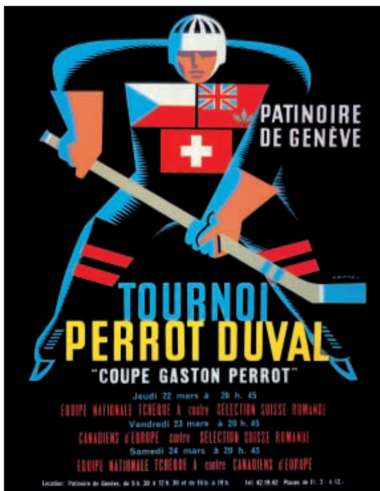
Affiche de la Coupe Gaston Perrot récompensant le vainqueur du tournoi de hockey sur glace joué durant la tenue du Salon International de l'Automobile à Genève en 1964.

En marge de son activité d'agent, Perrot Duval lance «PERROT DUVAL SERVICE», un label de qualité, une marque déposée et une organisation pour la maintenance, offrant partout des prestations similaires, le même accueil, les mêmes facilités et les mêmes avantages. Elle dispose, en Suisse romande, de 13 ateliers de maintenance et de 7 stations.