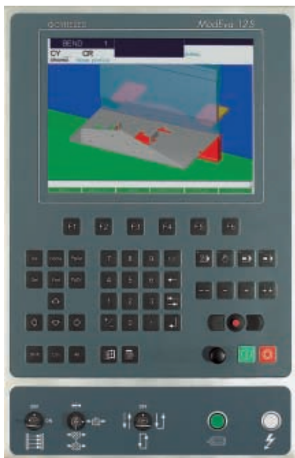
Commande numérique Modeva 12S de Cybelec S.A. Destinée, en premier lieu, au secteur des machines de déformation de métaux, cette commande est modulaire et évolutive. Elle est ainsi destinée à couvrir de nombreuses nouvelles applications.