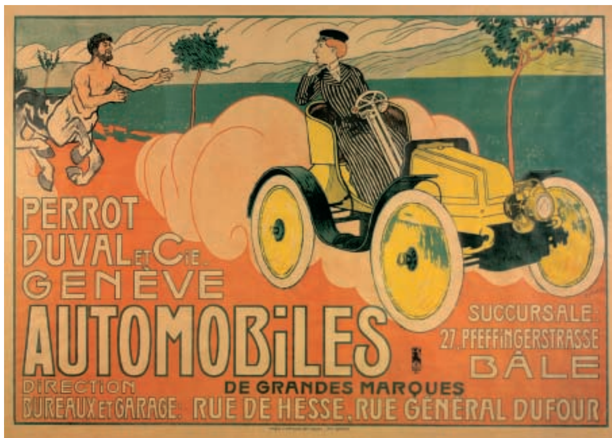
L'affiche de Perrot Duval en 1905.

Perrot Duval participe aux premières Expositions Nationales de l'Automobile et du Cycle qui se tiennent au Palais Electoral à Genève. Celle de 1905 regroupe 59 exposants et reçoit 17500 visiteurs.